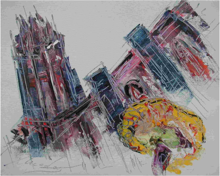
LLEIDA I NEUROLOGIA Autor: Antoni Sierra Uceda